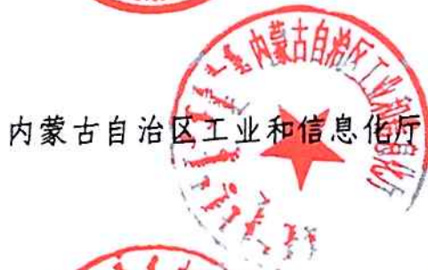
内蒙古自治区工业和信息化厅