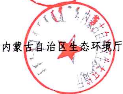
内蒙古自治区生态环境厅