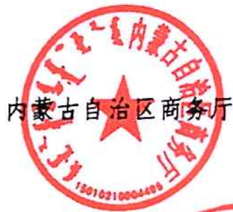
内蒙古自治区商务厅

各盟行政公署、市人民政府、各有关部门要切实加强组织领导，按职责分工积极推动相关政策措施尽快落地见效，切实促进我区汽车消费回升，进一步释放我区汽车消费潜力。